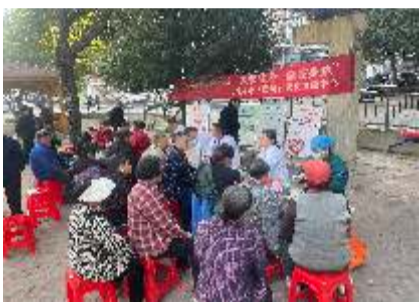
急性心梗牢记两个“120”

通过精准帮助村医,提升村医常见病的规范性治疗水平,能够有效降低农村医疗风险,也能让村民真正实现小病不出村。同时也是医院落实乡村振兴、医疗精准帮扶、基层服务联动等战略部署的重要举措。