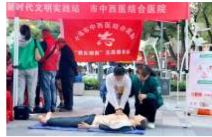
11月1日上午,市中西医结合医院联合车城路街道张湾社区新时代文明实践站开

展“中医文化进社区 健康生活伴你行”科普暨“学思想、强党建、重实践、建新功”党员志愿服务活动,通过现场义诊和展示体验,让市民近距离了解中医药文化知识。