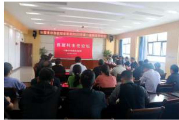
为持续提升我院整体医疗质量,促进多学科合作,提高科室及医院管理水平,我院于11月2日举办了首届科主任论坛。本次论坛旨在促进全院各科室相互了解开展

的医疗技术,尤其是特色技术和新技术、新项目,以利于科室间更好地协作,包括技术层面的支持配合、患者资源的共享,从而充分利用本院医疗技术资源,为患者提供更高水平的医疗服务。