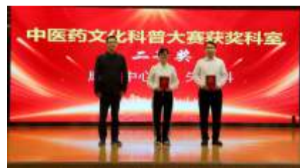
表彰文件, 院领导分别为15个获奖科室颁奖。

传播, 我院于9月21日举办了中医药文化科普大赛。通过比赛, 提升了医务人员健康教育能力, 鼓励更多的医务人员积极参与到健康科普知识传播的队伍中来。