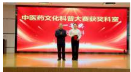
10月27日, 我院在17楼学术报告厅举行中医药文化科普大赛颁奖仪式, 院领导、各科室负责人及参赛队伍共120余人参加。