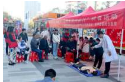
压、血糖监测。来自医院急诊科的的专家为居民们讲解教授了心肺复苏技术、气道

活动现场,市中西医结合医院组织医护人员进行了太极拳展示表演,为市民科普中医养生功法知识,传播特色中医文化。同时,来自医院内科、外科、妇产科、康复科、皮肤科的专家还在现场为居民把脉问诊,提供健康咨询和免费血